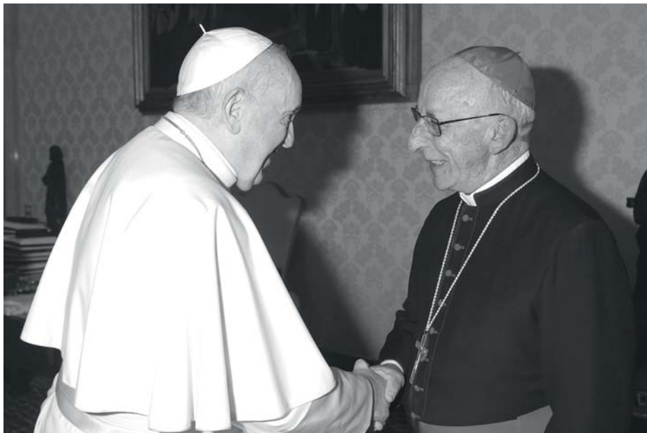
Saludo personal entre el Papa Francisco y nuestro obispo diocesano, el 28 de enero de 2022, en la Visita ad Limina.