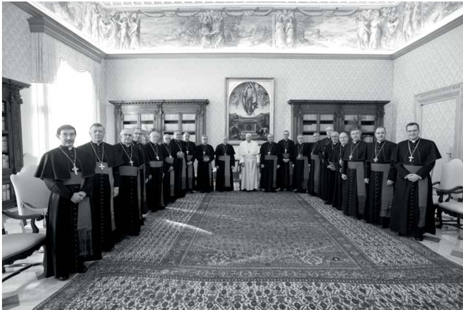
El Papa Francisco con los obispos españoles, entre ellos el de Sigüenza-Guadalajara, en su encuentro el 28 de enero de 2022 en el Vaticano durante la Visita ad Limina.